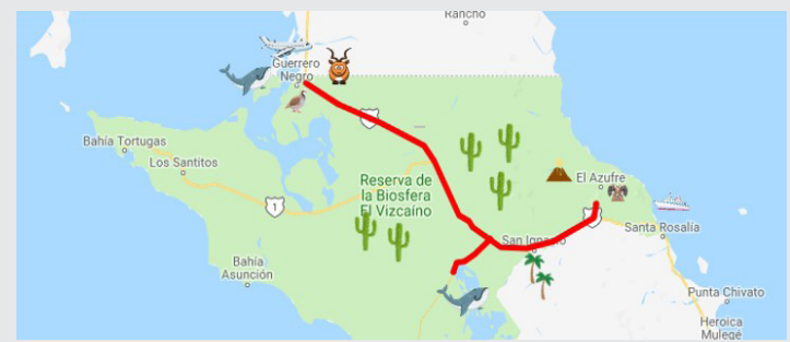
Figura 1. Mapa de “Ruta Naturaleza y Vida” del municipio de Mulegé, Baja California Sur.

Así mismo, a 214 kilómetros se encuentra La Laguna de San Ignacio, donde también se puede apreciar el avistamiento del mamífero, ofreciendo servicios de viaje en embarcación menor con un guía, restaurante y cabañas para descansar. Además, se recomienda la llegada a San Ignacio para visitar la presa y su oasis con inmensas palmas; esta ruta incluye la visita del Volcán de Las Tres Vírgenes a 45.6 kilómetros al sur, cerca del Ejido. Alfredo V. Bonfil, lugar donde se localiza el campamento del Borrego Cimarrón (figura 1).