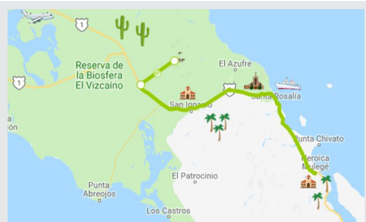
Figura 2. Mapa de “Ruta de la Historia” del municipio de Mulegé, Baja California Sur.

El segundo recorrido nombrado “Ruta de la Historia” por contener atractivos que representan la esencia de cada lugar del municipio. Al igual que la ruta anterior, se sugiere llegar por Guerrero Negro y trasladarse a la Sierra de San Francisco que se encuentra a 143 kilómetros del punto de partida; en este lugar, se encuentran las pinturas rupestres, mismas que fueron declaradas patrimonio de la humanidad por la UNESCO en 1993. Posteriormente, a 87 kilómetros al sur se ubica San Ignacio, que conserva la Misión de San Ignacio de Loyola de aproximadamente 250 años. Así mismo, se recomienda la visita a la cabecera municipal del municipio de Mulegé que es Santa Rosalía, donde se puede apreciar la arquitectura e infraestructura francesa, tales como: Iglesia de Santa Bárbara diseñada por Gustave Eiffel y las antiguas instalaciones de la Compañía El Boleo de capital francés dedicada a la extracción y fundición de cobre, siendo esta comunidad la segunda a nivel nacional en contar con el servicio energía eléctrica. Posteriormente, a 50 kilómetros al sur, se localiza la H. Mulegé, que posee la misión de Santa Rosalía con más de 300 años de existencia, siendo una de las más antiguas en el estado (figura 2).